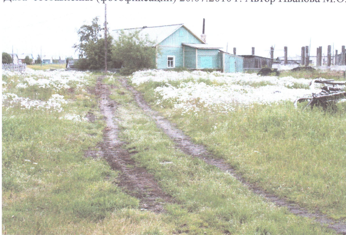
Фото 2. Место застройки утраченного памятника, вид с северо-запада. Дата составления (фотофиксации) 20.07.2010 г.