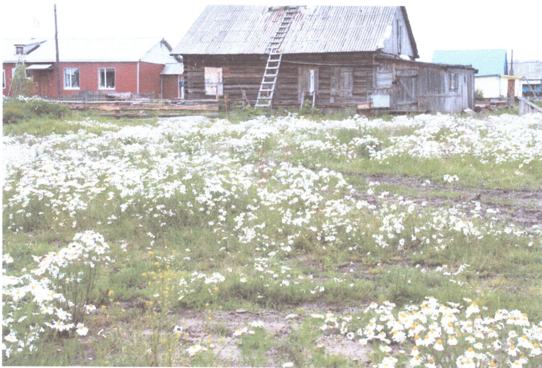
Фото 1. Место застройки утраченного памятника, вид с юго-востока. Дата составления (фотофиксации) 20.07.2010 г.